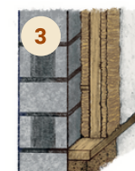
CORRECTEUR THERMIQUE TERREPAILLE