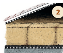
ISOLATION COMBLES BLOCPAILLE