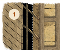
BARDAGE BOIS / OSSATURE BOIS BLOCPAILLE